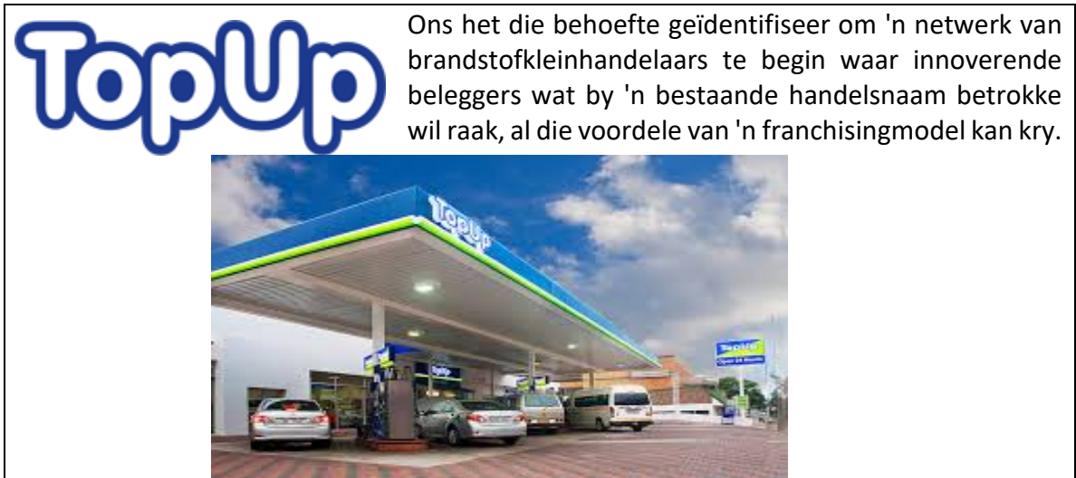
[Aangepas uit: < https://TopUp.servicestations.co.za > Feb. 2020 afgelaai]

6.1 TopUp se diensstasies sal moontlik groot bedrae kapitaal belê soos wat hulle hul werksaamhede oor die hele Suid-Afrika uitbrei. Verduidelik hoe TopUp-diensstasies die volgende drie beleggingskriteria moet gebruik wanneer die volgende beleggingsopsies oorweeg word.